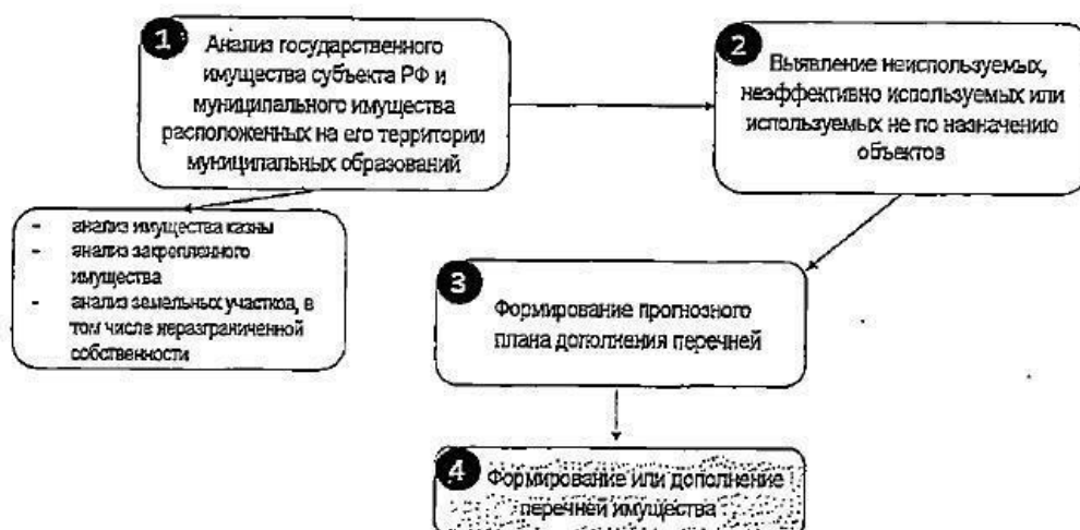
Рисунок 1. Примерная схема формирования прогнозного плана дополнения Перечней

9.4. При формировании прогнозного плана предоставления имущества рекомендуется: